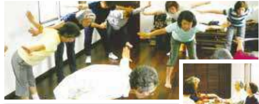
楽しい時間が健康の秘訣

最近では高齢化が進み平均年齢が高くなりがちです。町内会でアピールして、少しでも平均年齢を下げたい気持ちでいます。