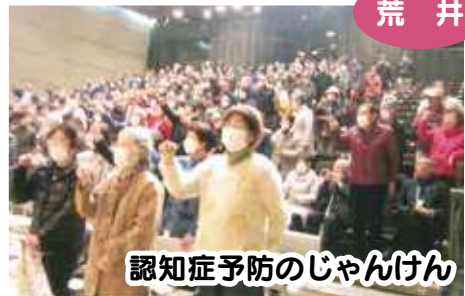
認知症予防のじゃんけん