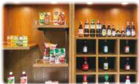
展示コーナーでは、あの商品やこの商品もキッコーマンの食品なんだと再認識。

以前、荒井の街は蒸した大豆の匂いがしていたものですが、今の工場内は、整理・整頓・衛生管理が徹底されており、ほのかな匂いがある程度で、機械音が静かだったことも印象的でした。 今回の春季合同歩こう会開催においては、天候や事故などの心配もありましたが、荒井老連役員及び会員の協力により、企画が無事終了できましたことを心より感謝いたします。