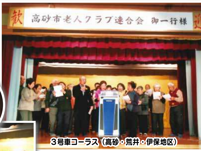
3号車コーラス (高砂・荒井・伊保地区)

新春親睦バス旅行を2月2日、165名が参加のもと開催しました。名湯有馬温泉向陽閣でおいしい食事と入浴、散策とゆっくり旅を楽しみ、帰りは、めんたいパークに立ち寄り、おみやげをたくさん買い求め、皆さん無事に帰宅されました。