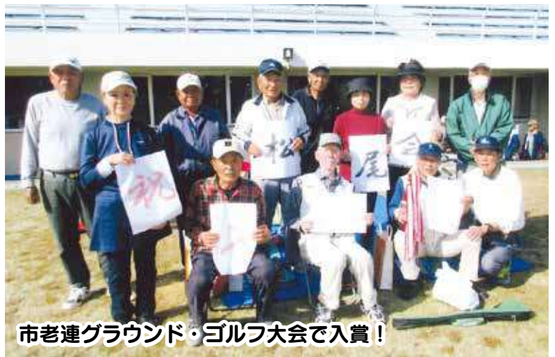
市老連グラウンド・ゴルフ大会で入賞!

大会に合わせ、週3日の練習をしながら上位入賞を目指しております。100歳体操は、福祉部を中心に毎週金曜日に和気あいあいと楽しく、体を動かしています。 教養部門では、毎年2回、高砂市まちづくり出前講座を開催し、多くの会員が学習しております。 福祉部門では、通年、平成17年より、子ども見守り活動に15名が登下校時に子どもたちの安全に取り組んでいるほか、8月には、子ども会主催の地藏盆まつり、子どもたちのお参り時の交通整理に協力しています。 最後に、阿弥陀町老連や市老連事業にも、積極的に参加するよう努めています。皆さんのご支援をよろしくお願いいたします。 これからも「健康・奉仕・友愛」活動に一生懸命頑張ります。