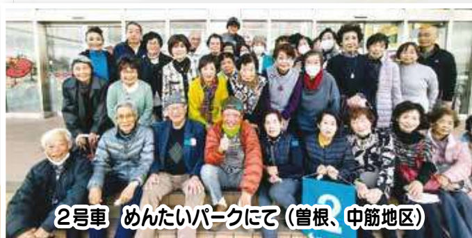
2号車 めんたいパークにて (曽根、中筋地区)