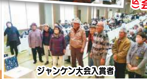
ジャンケン大会入賞者