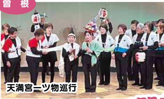
天満宮一ツ物巡行