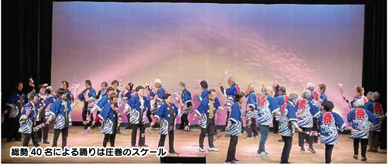
総勢 40 名による踊りは圧巻のスケール