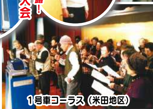
1号車コーラス (米田地区)