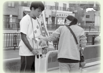
▲赤い羽根共同募金