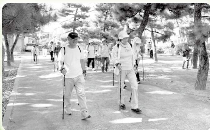
ノルディックウォーキング