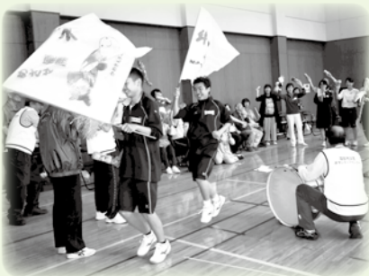
▲こころみ楽リエーション