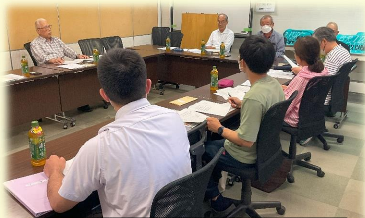
荒井地区支え合いづくり協議会役員会の様子