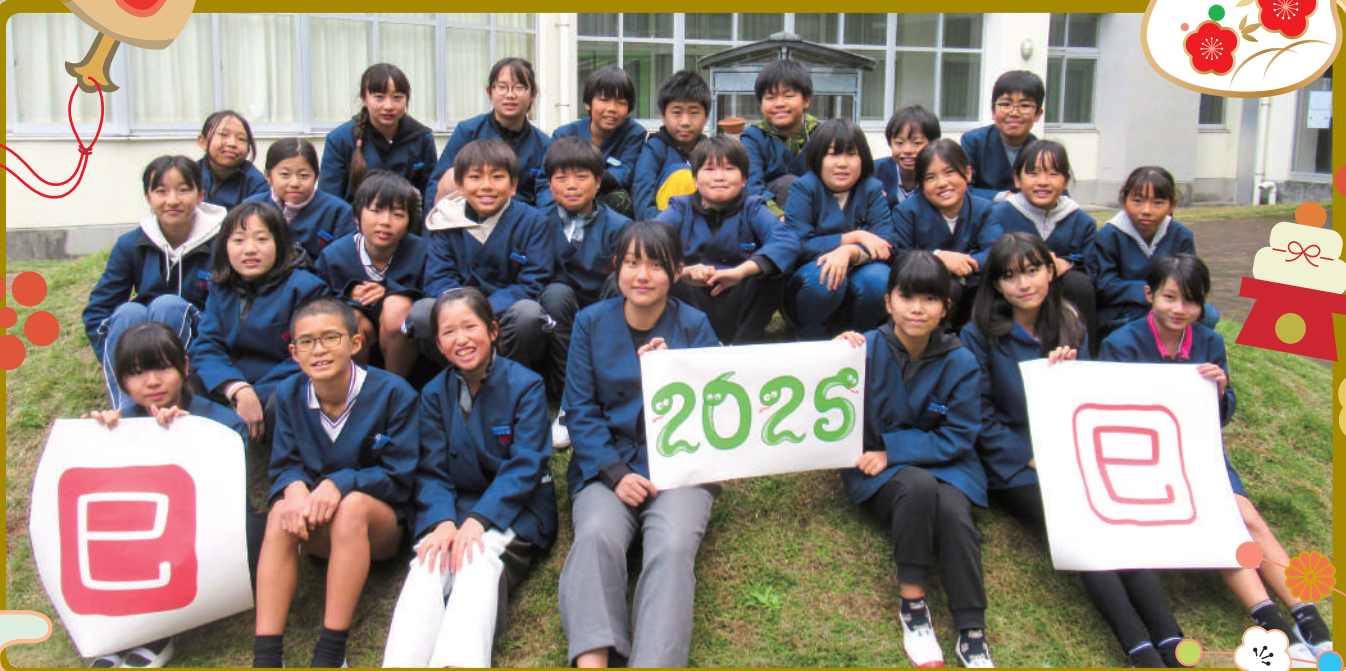
▲阿弥陀小学校6年生の児童のみなさん