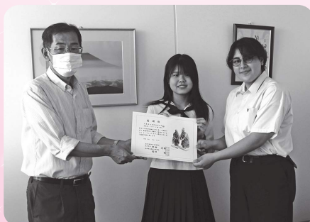
県立高砂高等学校