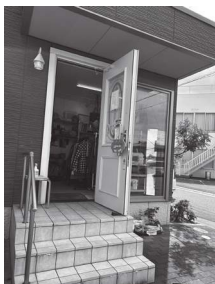
自由空間 高砂市荒井町千鳥3-4-10

以前、自由空間の広告を社協だよりに掲載していただいたことをきっかけに善意銀行のことを知り、20年ほど前から善意銀行へ寄附をさせていただいております。市民の方からご寄附いただいた物品に値段をつけて、自由空間に来てくださったお客様に販売をし、その売上げを善意銀行へ寄附させていただいております。物品のご寄附をしてくださった方々は、社協だよりに『自由空間』の名前が載ると、高砂市の福祉のために貢献できたことをとても喜んでいらっしゃいます。