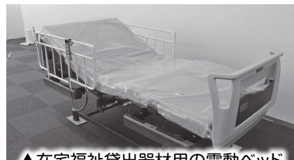
▲在宅福祉貸出器材用の電動ベッド (花浄院 高砂店・宝殿店様より寄贈)

高砂市善意銀行では、市民の皆さまから寄せられた貴重な寄附金を、地域福祉向上のための財源として活用しています。