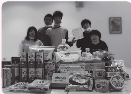
放課後等デイサービスDream