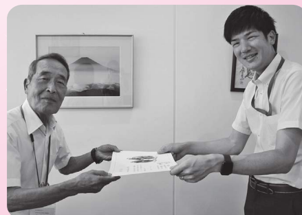
カネカ労働組合高砂支部