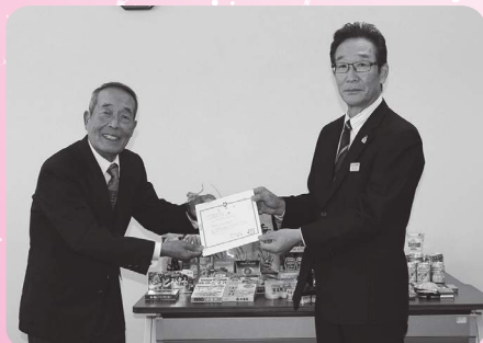
兵庫南農業協同組合JA兵庫南女性会