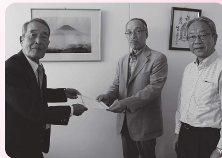
高砂市高齢者大学 松陽学園学生自治会