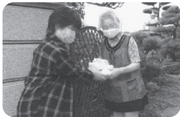
◆米田町 米田福祉部会(7月11日～31日) 高齢者宅等を対象に見守り訪問を実施、マスクやウェットシートを配布して近況をお聞きする。