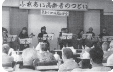
◆高砂町 第5福祉部会(6月18日) 松陽三線隊の演奏会や折り紙、抽選大会など盛りだくさんのプログラムで交流を図る。