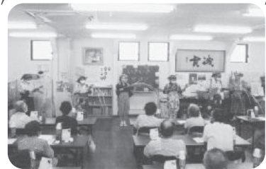
◆阿弥陀町 阿弥陀東福祉部会(7月9日) いなみ野学園南京玉すだれ同好会による演技や、脳トレクイズ、お楽しみくじ引き等で楽しく交流を深める。

新型コロナウイルス感染防止対策をして実施いただいています。紙面の都合上、一部の活動のみ掲載しています。