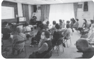
◆高砂町 第2福祉部会(6月19日) 久しぶりにサロンを開催、体操の後、綾小路きみまろのDVDで大笑い楽しいひと時を過ごす。

～各地域では、「ふれあいいきいきサロン」や見守りが必要な方への「ゆうあい訪問活動」等が福祉委員や民生委員・児童委員の創意工夫により、活発に行われています。今回は、6月～8月に開催された活動の一部をご紹介します～