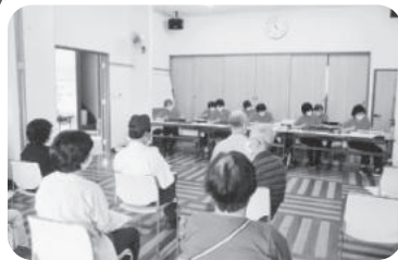
◆米田町 中島三丁目福祉部会(8月28日) 松陽学園大正琴クラブを招いて演奏会を実施、参加者の年代に合わせた選曲に懐かしく口ずさむ。