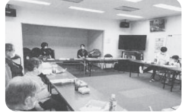
◆高砂町 第6福祉部会(7月21日) 三世代が集まり健康についての講話を聞いた後、ケーキを頂き談笑。