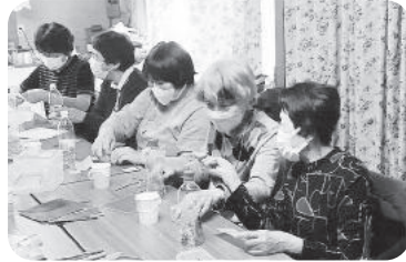
◆中筋校区 中筋西福祉部会(3月14日) 播州弁ラジオ体操で身体をほぐした後、手作りペットボトルボーリングを楽しむ。