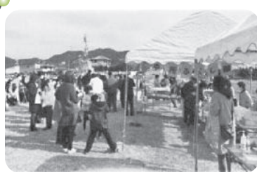
◆阿弥陀町 中所福祉部会(1月9日) [とんど]を開催、つくたてのお餅などの振るまいやお菓子のつかみ取りなどを多くの方に楽しんで頂き三世交流を図る。