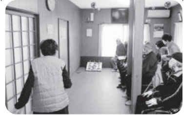
◆中筋校区 中筋一丁目福祉部会(2月18日) ラジオ体操の後、輪投げを2ラウンド行いスコアの競争、高得点に大盛り上がり。