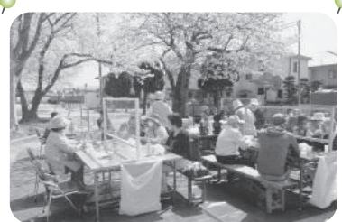
◆阿弥陀町 魚橋北福祉部会(4月10日) [地域交流ふれあいお花見会]を開催、満開の桜の下で賑やかに歓談する。

新型コロナウイルス感染防止対策をして実施いただいています。紙面の都合上、一部の活動のみ掲載しています。