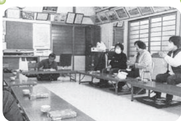
◆米田町 古新福祉部会(3月5日) 参加者の方に、沖縄の楽器「三線」で「涙そうそう」等の弾き語りをして頂く。