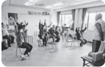
◆荒井町 小松原団地福祉部会(3月24日) レクリエーションゲームや健康づくり体操、カラオケ等で楽しい時間を過ごす。

～各地域では、「ふれあいいきいきサロン」や見守りが必要な方への「ゆうあい訪問活動」等が福祉委員や民生委員・児童委員の創意工夫により、活発に行われています。今回は、1月～4月に開催された活動の一部をご紹介します～